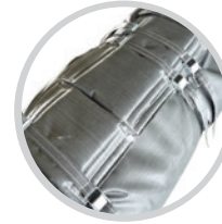
Wärmeisoliermatten für Maschinen