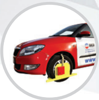
Sicherungskrallen für Fahrzeuge