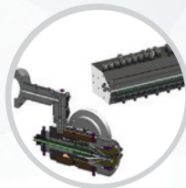
Konstruktion und Herstellung von Kunststoff-Extrusionswerkzeugen (Köpfe, Düsen usw.)