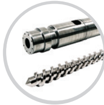
Schnecken und Zylinder