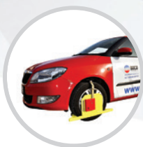
Блокираторы колес автомобиля