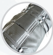
Термоизоляционные чехлы для машин