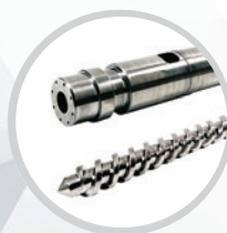
Шнеки и цилиндры