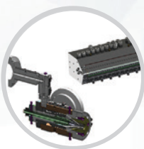
Дизайн и производство инструментов для экструзии пластмасс (головки, сопла и т.д.)