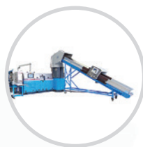
Линии по переработке