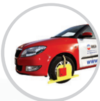
Sicherungskrallen für Fahrzeuge